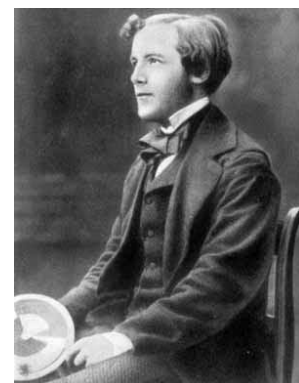
James Clerk Maxwell